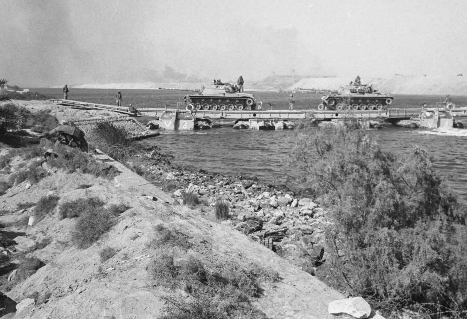
השריון של צה"ל צולח את התעלה על גבי דוברת תמסחים | צילום: ארכיון צה"ל

צה"ל במהלך המלחמה, לא הצליח המודיעין הצבאי המצרי לעמוד על הכנות צה"ל לצליחת התעלה, וגם אם התקבלו ידיעות כלשהן בנושא, הן לא זכו להתייחסות ראויה. תקלות מודיעין היו גם בצד המצרי.