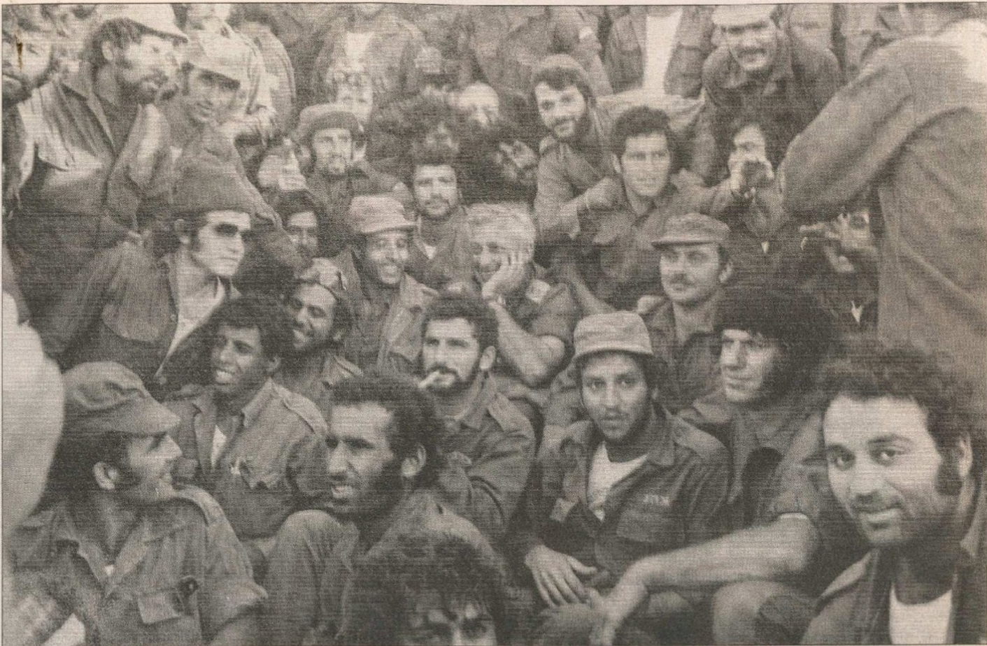
סוף המלחמה. אריאל שרון יושב במרכז חבורת חיילים, בהגיע הידיעה על הפסקת האש.

נשכוחותיו פרושים כ־25 קילומטר מערב לתעלה, ארז נוסע צפונה לסמן טריטוריה. בדרך הוא רואה חיילי צה"ל תופסים עשרה שבויים. אחרי שעה הוא חוזר ומוצא את השבויים אוכלים ארטיקים פה"גולן". "אנחנו נכנעו לא יודעים לשנוא את האויב", הוא צוחק