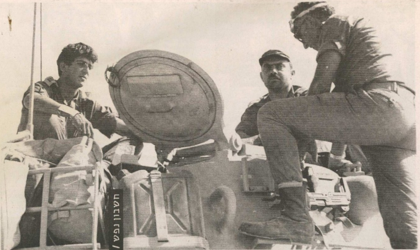
"ידעתי שהצליחה תלויה בי, ואם העסק הזה נכשל, קשה יהיה לעשות אותו שוב". ארו עם קצינים בעת הקרבות