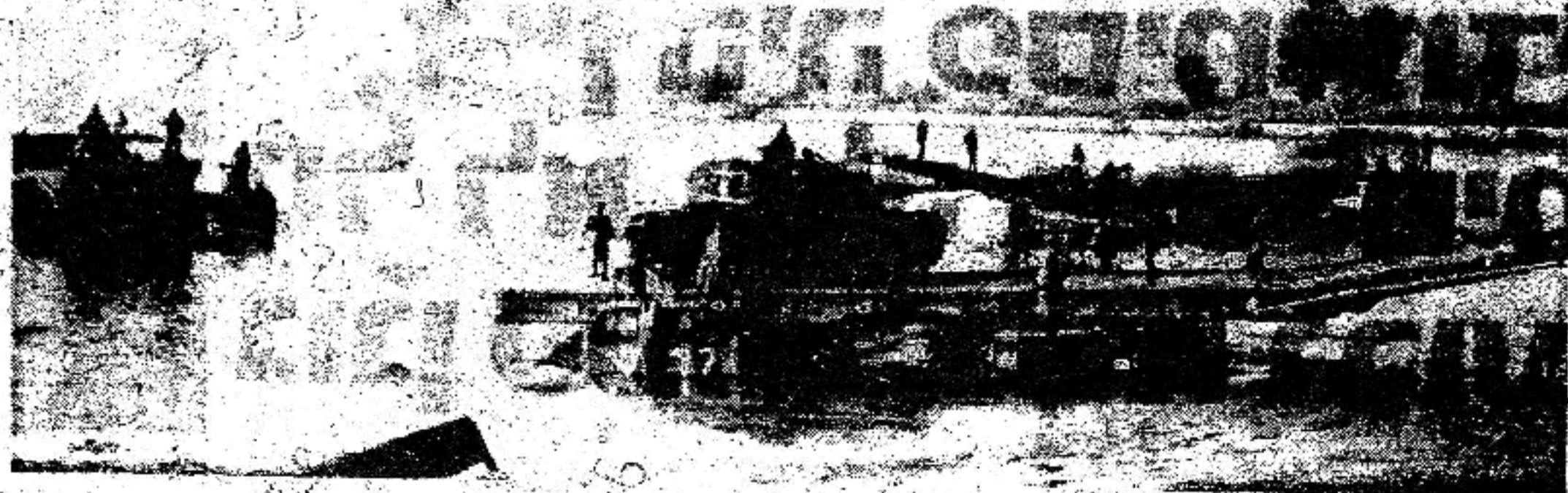
טנקים ישראליים גולחים את התעלה על גבי המסמחים

טילים, נפצע וסונה לבסוף נזתה הדינאור... נשאר מנת בצדו של צירי עכבר — מצבה אילת למאכזים העל-אנושיים של בני-אנוש ההתמודד עכו.