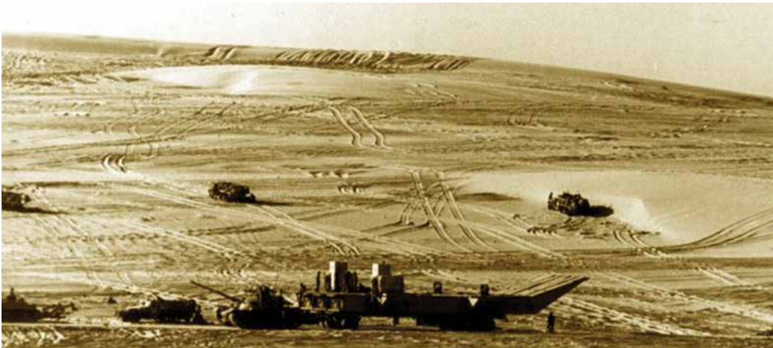
טנק של גדוד 264 גורר דוברת בציר "מבדיל"

המערכת של התעלה ביממה הקריטית של מבצע "אבירי לב". ה"תמסחים" הגיעו אל התעלה בכוחות עצמם, ותרומתו של כוח הטנקים מחטיבה 421 שבמסגרתו נעו הייתה רק בליוויים. קידומן של הדוברות, לעומת זאת, היה כרוך במאמץ סיזיפי של הטנקים והצוותים מחטיבה 421 (3- הצוותים מהגזרה הצפונית), להתגבר על רצף של מכשולים פיזיים, ומכשולים מעשה ידי אדם. בסופו של דבר, למרות שהדוברות הגיעו למים באיחור של 32 שעות, גשר הדוברות הוא שאפשר את מטרתו העיקרית של מבצע "אבירי לב" - העברת מסות של שריון לשטחי התמרון ממערב לתעלה. נסיך אמצעי הצליחה - גשר הגלילים - החל למלא את ייעודו רק ב-19 באוקטובר, לאחר שהמסה העיקרית של יחידות אוגדה 162 וכוחות נוספים כבר עברו על גבי גשר הדוברות והתמסחים.