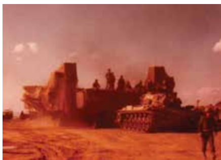
טנק של גדוד 264 גורר דוברת