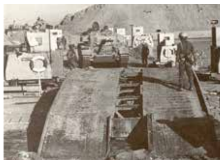
גשר הדוברות עם גשר של טנק גישור על הקטע שנפגע

ממשיך ומספר מ"פ א': "אנחנו הגענו ליד ה'הוקים' [סוללת טילי נ"ט מ"הוק" שהייתה פרושה בכנסייה לציר "עכביש" - ע"מ] רק בסביבות השעה 21:00. מפה התנועה הייתה איטית מאד. היה לנו