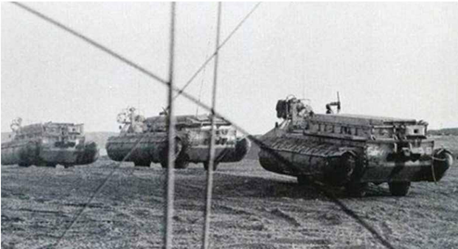
גדוד ה"תמסחים" בתנועה

שלי. אמרתי 'רות סוף' ובוזה גמרתי את השיחה. פה היה תדלוק למי שהספיק. התקדמנו לאורך הציר, למעשה את כול ה-16 באוקטובר לאור יום חיכינו על ציר 'עכביש', רתומים. 12