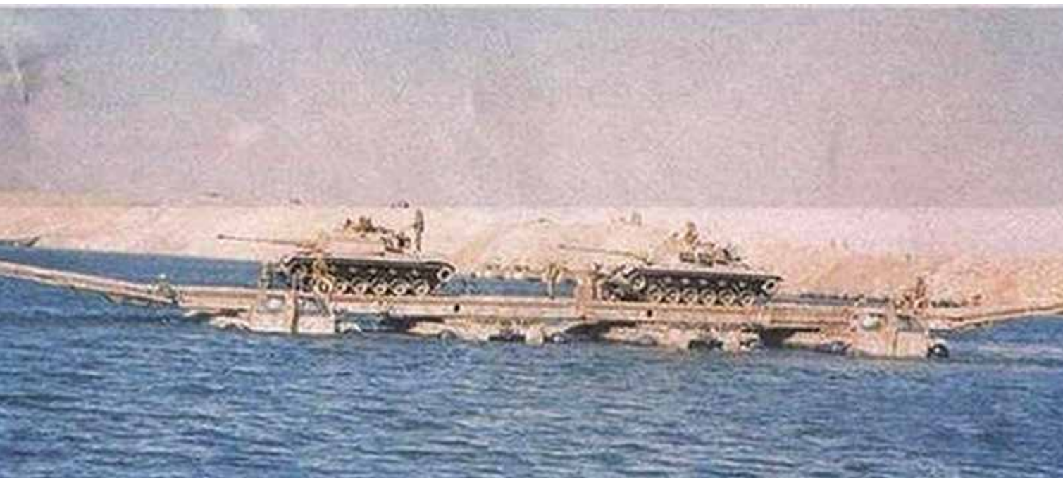
צמד טנקים של גדוד 257 עולים על דוברת "תמסח" דו-כיוונית

04:00 הגיע כוח מג"ד 264 עם גדוד ה"תמסחים" ל"מצמד". עם הכוח הגיע למקום מפקד האוגדה האלוף אריאל שרון, שהכיר במדויק את נקודות הירידה למים שהוכנו בתקופתו כאלוף הפיקוד, ובהנחייתו החלו הדחפורים שהגיעו עם הגדוד לפרוץ את סוללת העפר ולהכינה לירידת ה"תמסחים" למים. ה"תמסחים" הראשונים החלו לרדת למים קצת אחרי 06:00. לפי התרגולת ה"תמסחים" נכנסו למים תוך שהם מעלים את הגלגלים ומנפחים את בלוני האוויר שלאורך גופם, המשמשים כמצופים. בשלב ראשון חוברו 5 שלשות של "תמסחים" לדוברת חד-כיוונית, ולקראת השעה 07:00 הוחל בהעברת 10 טנקי גדוד 264. בהמשך חוברו 4 דוברות חד-כיווניות ל-2 דוברות דו-כיווניות ואלה העבירו את 18 טנקי גדוד 257 של חטיבה 421 וחפ"ק המח"ט ואת פלוגת החרמ"ש שצורפה לגדוד החל מ-09:00. בנוסף העבירו דוברות ה"תמסח" במשך היום כלים של חטיבת הצנחנים 247. בבוקר 17 באוקטובר העבירו דוברות ה"תמסח" את כוח מג"ד 599 (מחטיבה 421) שכלל פלוגת טנקים (8 טנקים), פלוגת החרמ"ש (זחל"מים) של הגדוד שנשא איתה תחמושת עבור טנקי החטיבה שצולחו ופעלו בגדה המערבית של התעלה ביום הקודם, וכן תאג"ד 599, ו-2 מכליות סולר. תוך כדי העברת זחל"מי גדוד 599 נפגעה הדוברת החד-כיוונית מפגז מרגמה, ובהמשך טבעה. בהמשך היום צלחו על גבי 2 הדוברות הנותרות 2 פלוגות גדוד 264 שגררו את הדוברות ל"מצמד" (סך הכול 10 טנקים).