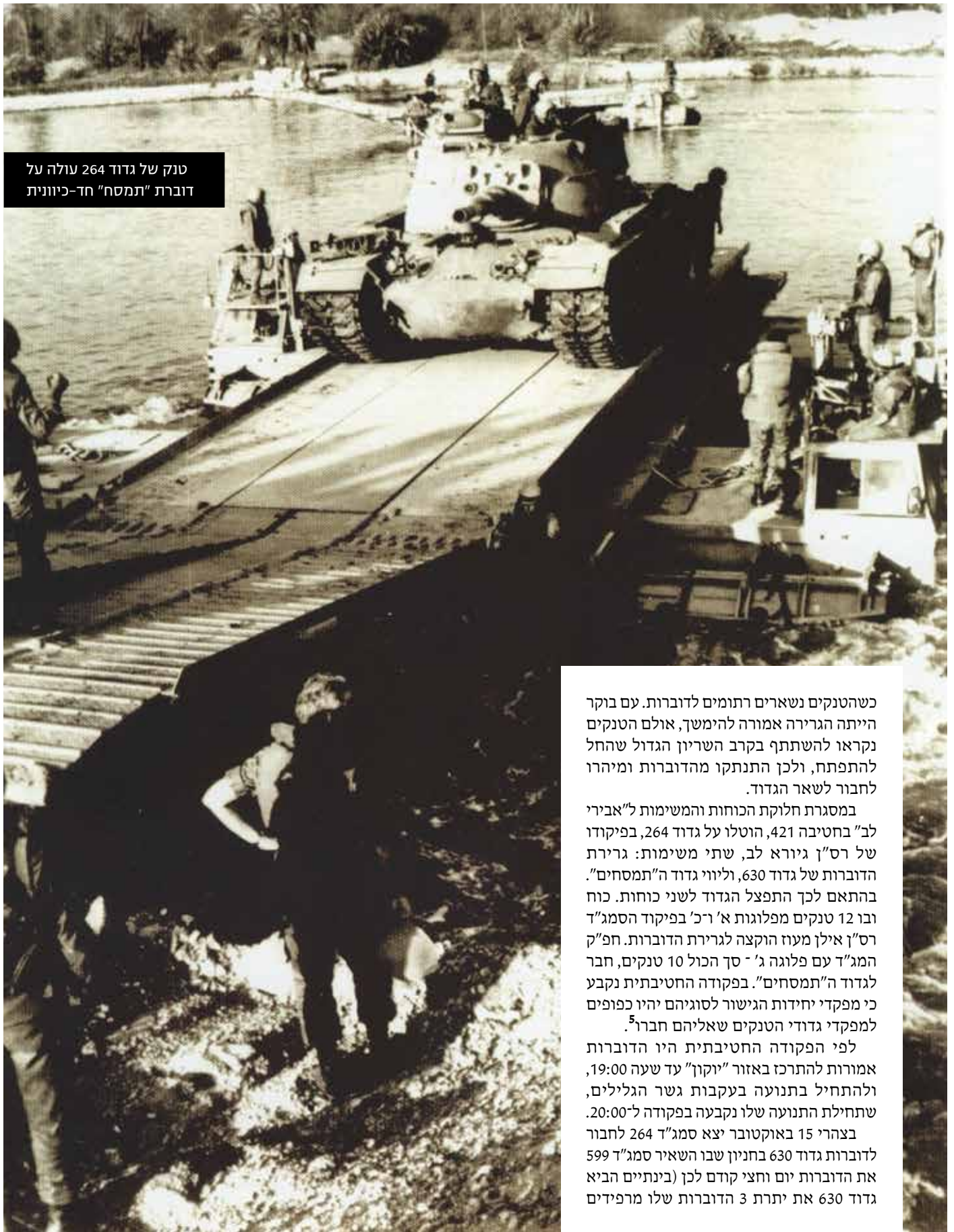
טנק של גדוד 264 עולה על דוברת "תמסח" חד-כיוונית

כשהטנקים נשארים רתומים לדוברות. עם בוקר הייתה הגרירה אמורה להימשך, אולם הטנקים נקראו להשתתף בקרב השריון הגדול שהחל להתפתח, ולכן התנתקו מהדוברות ומיהרו לחבור לשאר הגדוד.