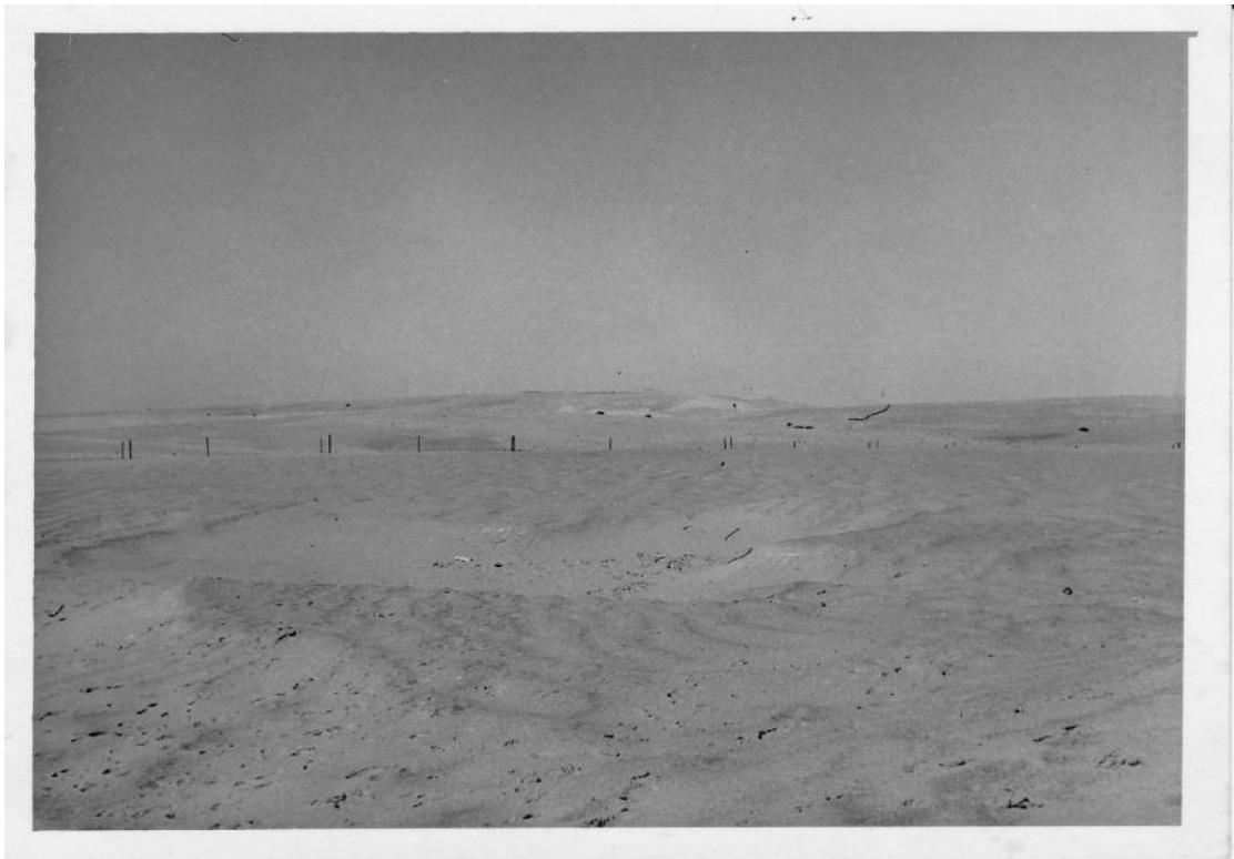
איור מס' 31 - כת'יב אבו טרבוש מכיוון "חמדיה". הנקודות השחורות : טנקים מצרים מושמדים (18)